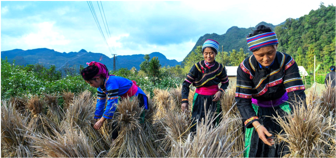
꺼라오(Cờ Lao)족의 주요생산 작물은 쌀이다

이들 사회는 부계 중심적인 핵가족 사회이다. 언뜻 보기에 한집에 보통 2-3세대에 걸쳐 함께 살아 가지만, 각 세대는 자신들의 독립적인 경제 생활단위를 이루고 있다. 일부일처제(一夫一妻制)가 원칙이며, 일부다처제나 이혼은 드물다. 같은 씨족 내 구성원들간 뿐만 아니라 같은 마을 안에서도 새집을 짓거나, 결혼식, 출산, 장례식 등의 특별한 경우에 서로 상부상조하는 전통이 남아있다. 또한 같은 씨족의 구성원들끼리는 서로 무상으로 도와야 하는 의무가 있다.