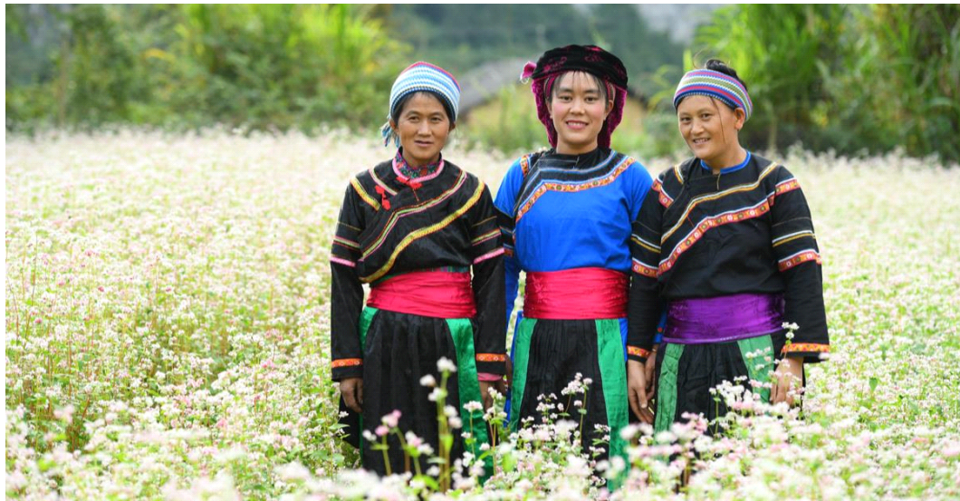
전통의상을 입은 꺼라오(Cờ Lao)족 여성들