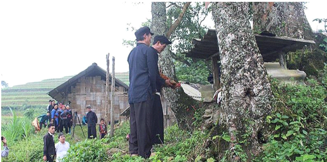
호양 반 통(Hoàng Văn Thùng)을 숭배하는 꺼라오(Cờ Lao)족의 의식

2019년 53개 소수종족을 대상으로 한 설문조사 데이터에 따른 꺼라오(Cờ Lao)족의 교육여건을 살펴보면 읽고 쓸 수 있는 15세 이상 인구의 비율은 58.2%이다. 초등학교 수준의 어린이 출석률은 103.4%, 중학교 수준은 83.1%, 고등학교 수준: 37.4%이며, 학교를 다니지 않는 비율은 17.4%이다.