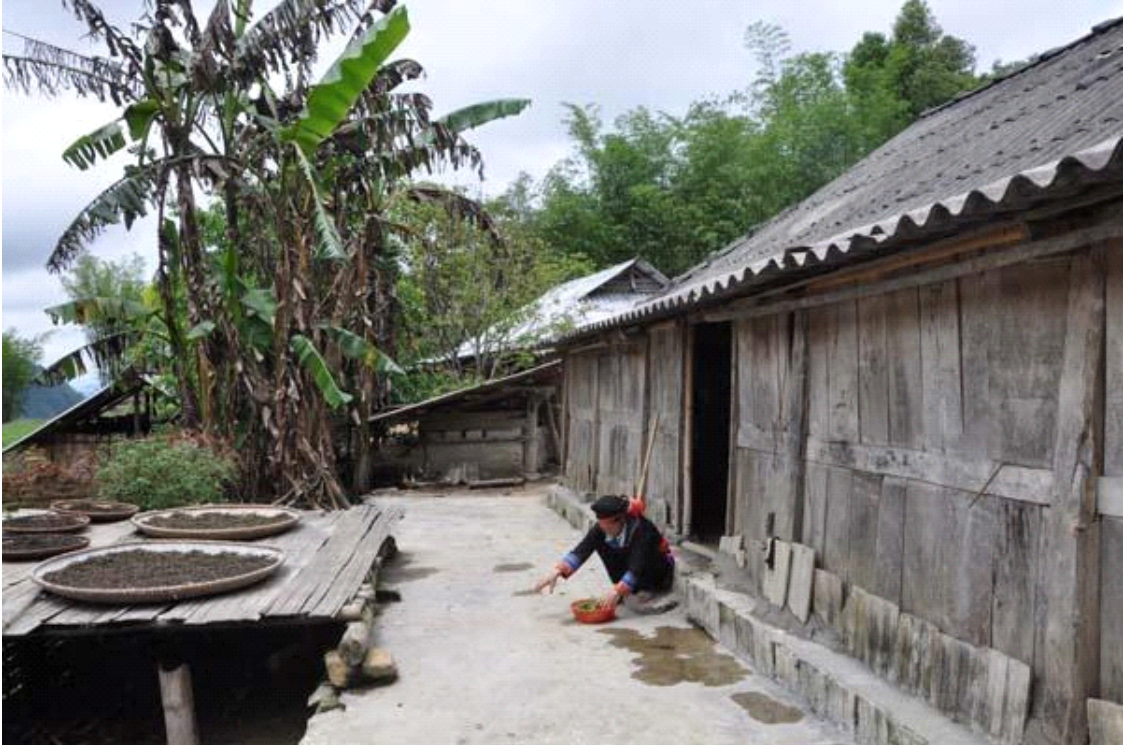
전통가옥을 고수하는 꺼라오(Cờ Lao)족

꺼라오(Cờ Lao)족은 토양과 그것을 둘러싼 자연환경의 조건에 맞도록 여러 다양한 작물을 재배한다. 동반(Đông Văn) 지역은 경작지가 제한되어 있고, 하천이 적어 이곳에 거주하는 이들은 화전이나 바위 사이의 작은 땅에서 작물을 재배한다. 주요 재배작물은 옥수수이며, 그 외 호밀, 콩, 완두콩과 여러 야채류이다. 또한 집약적 농업을 하며, 동물성비료를 사용하는데, 최근에는 식물성이나 인분도 비료로 사용하고 있다.