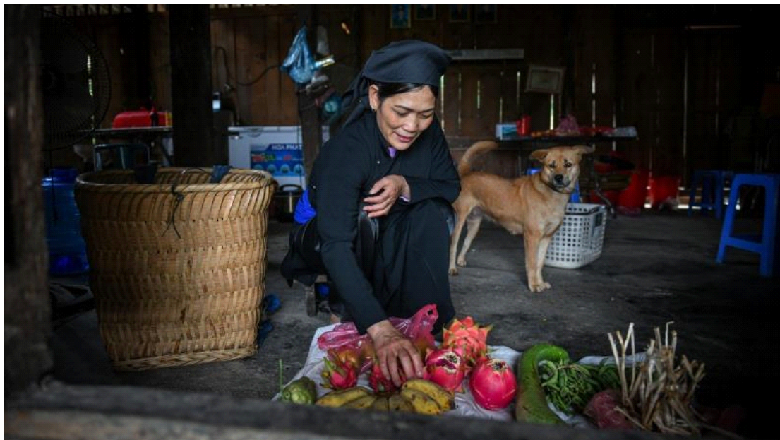
라찌(La Chí)족 생활모습, 사진: 텃땃(Thành Đạt), 출처: https://vietnam.vnanet.vn

전통적으로 논농사와 계단식 농업을 한다. 저지대에서는 모내기를 하고, 밭에는 옥수수, 고구마, 카사바 등의 작물을 재배하며, 일부 기름진 밭과 토지는 목화와 인디고(indigo) 2) 를 재배한다. 차나무는 1990년대부터 라찌(La Chí)족의 귀중한 상품이 되었고, 양어업(養漁業) 3) 역시 새로운 경제 활동이지만 라찌(La Chí)족 사이에서 인기를 끌고 있다. 또한 라찌(La Chí)족의 소와 가금류 등의 사육 4) 은 라찌(La Chí)족의 소득증대에 기여하는 것 외에도 제사에 바치는 제물로도 쓰인다.