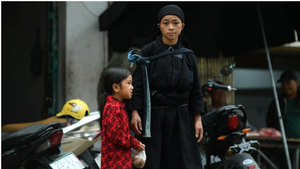
라찌(La Chí)족 여인