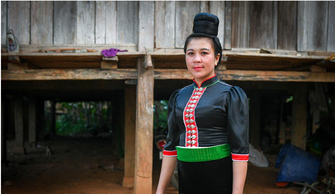
전통의상을 입은 라하족(La Ha)여성, 닷닷(THÀNH ĐẠT), 출처: https://vietnam.vnanet.vn