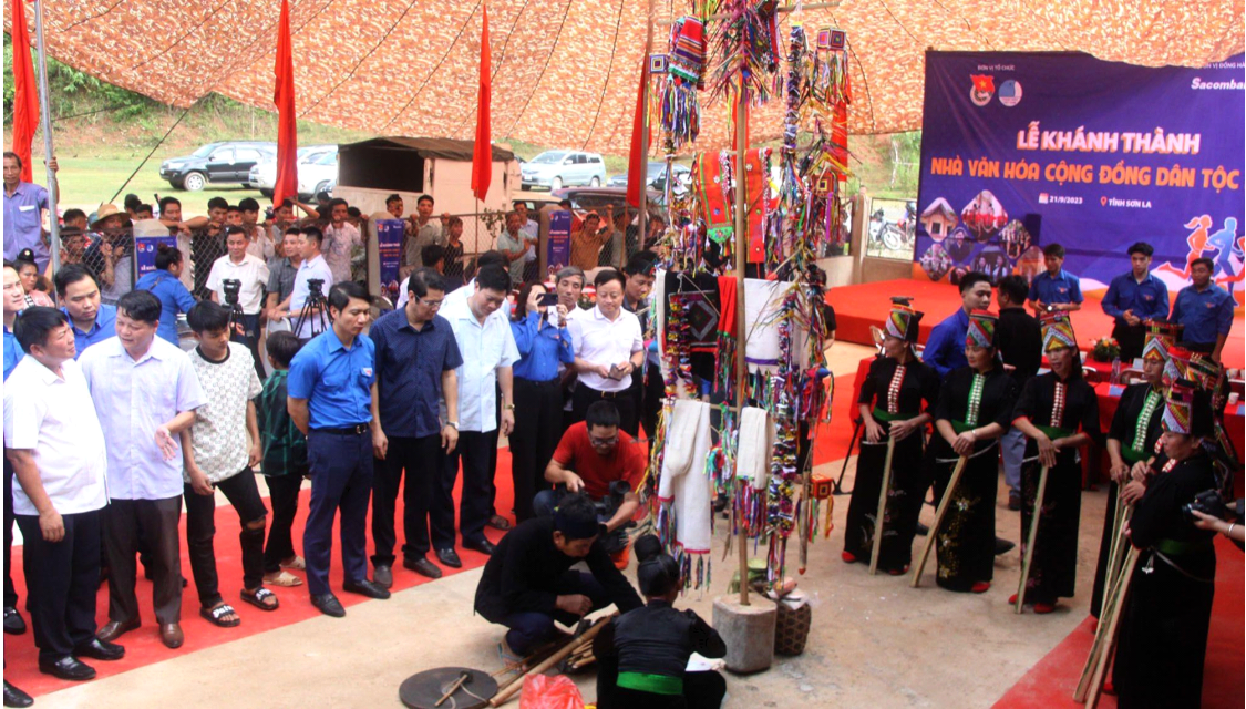
복원된 라하족(La Ha)족의 팡아(Pang A) 종족 축제

는 쓰러진 나무를 약탈하거나, 가축을 사냥하거나 방생하는 등의 행위를 할 수 없다.