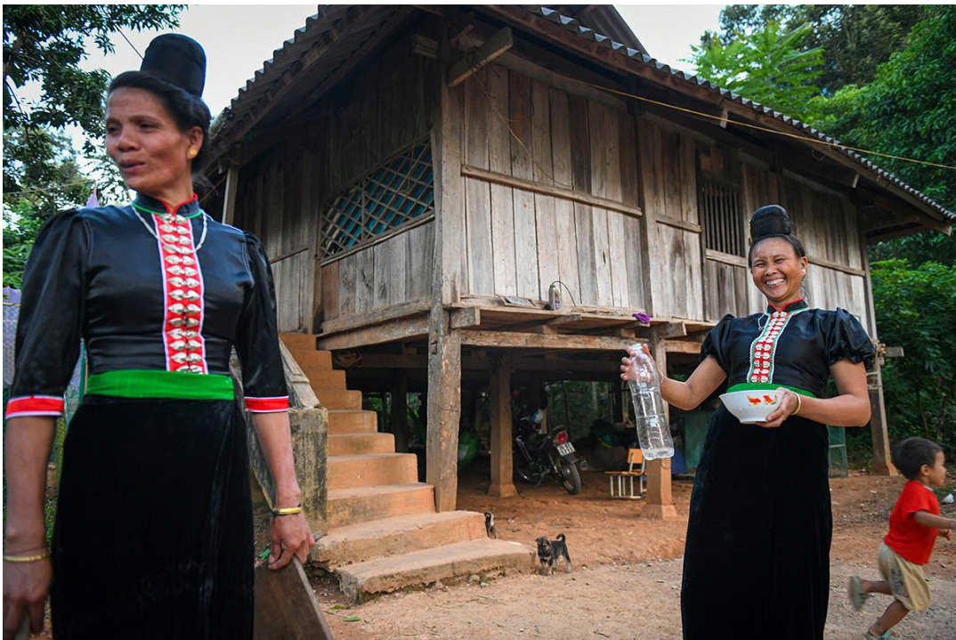
라하족(La Ha)마을에서 흔히 볼 수 있는 수상가옥, 텃밭(THÀNH ĐẤT)

라하(La Ha)족 마을에는 구조, 크기, 견고성이 다른 두 가지 유형의 수상 가옥이 존재한다. 임시 수상 가옥은 매설(埋設) 2) 된 나무 기둥으로 지어졌으며 방 2개와 별채 2개로 구성되어 있다. 이 방에는 칸막이가 없으며, 하나는 주방용이고 다른 하나는 수면용이다. 예배를 드려야 하는 가족들을 위해 부엌에 제단 기둥이 추가로 세워져 있다. 라하(La Ha)족 마을에서는 임시 수상 가옥에 비해 상대적으로 영구적인 수상 가옥이 인기가 있다.