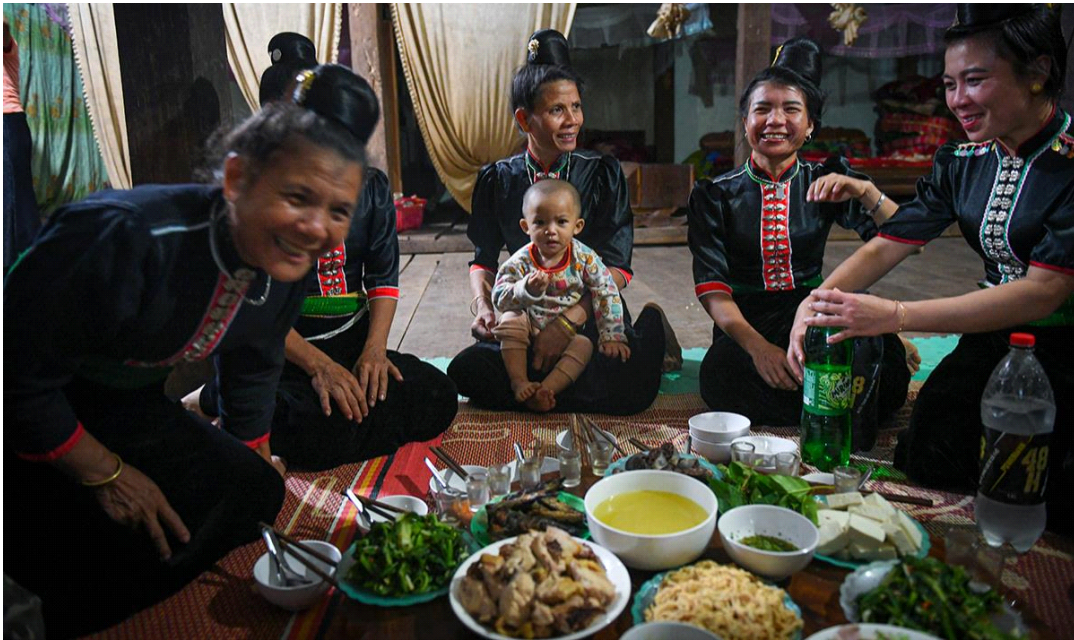
라하족(La Ha) 사람들은 손님에게 쌀 한 접시를 대접한다, 텃밭(THANH ĐÀT), 출처: https://vietnam.vnanet.vn

사는 것을 고려해야 한다. 유산은 장남이나 남편의 형제들에게 주어진다. 신랑의 가족이 신부의 가족에게 지불해야 하는 결혼 예물비용은 매우 비싸다. 신랑은 결혼 후 4-5년 동안 신부의 집에서 살아야 하며, 신부에 대한 몸값으로 3,5량의 은을 장인장모에게 드려야 한다. 그렇지만 결혼에 대한 인식이 바뀌게 되어, 더 이상 돈으로 사고파는 관계가 아니며, 신랑의 처가댁 의무적으로 거주하는 기간도 2-3년으로 줄어들었다.