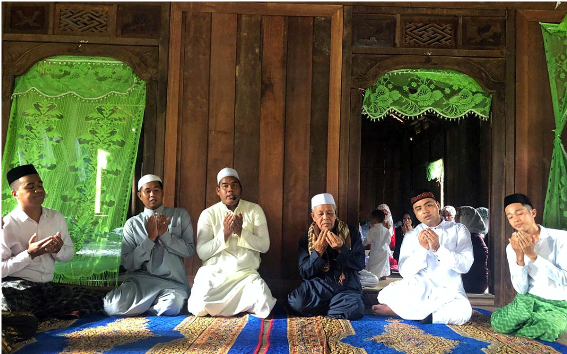
기도하는 짬(Chăm)족 무슬림, 사진출처: nhandan.vn

짬(Chăm)족의 장례는 죽은 사람을 사후 세계로 데려가는 두 가지 방법이 있는데, 매장(埋葬)과 화장(火葬)이다. 같은 가문의 사람들은 어머니의 혈통에 따라 같은 장소에 묻는다.