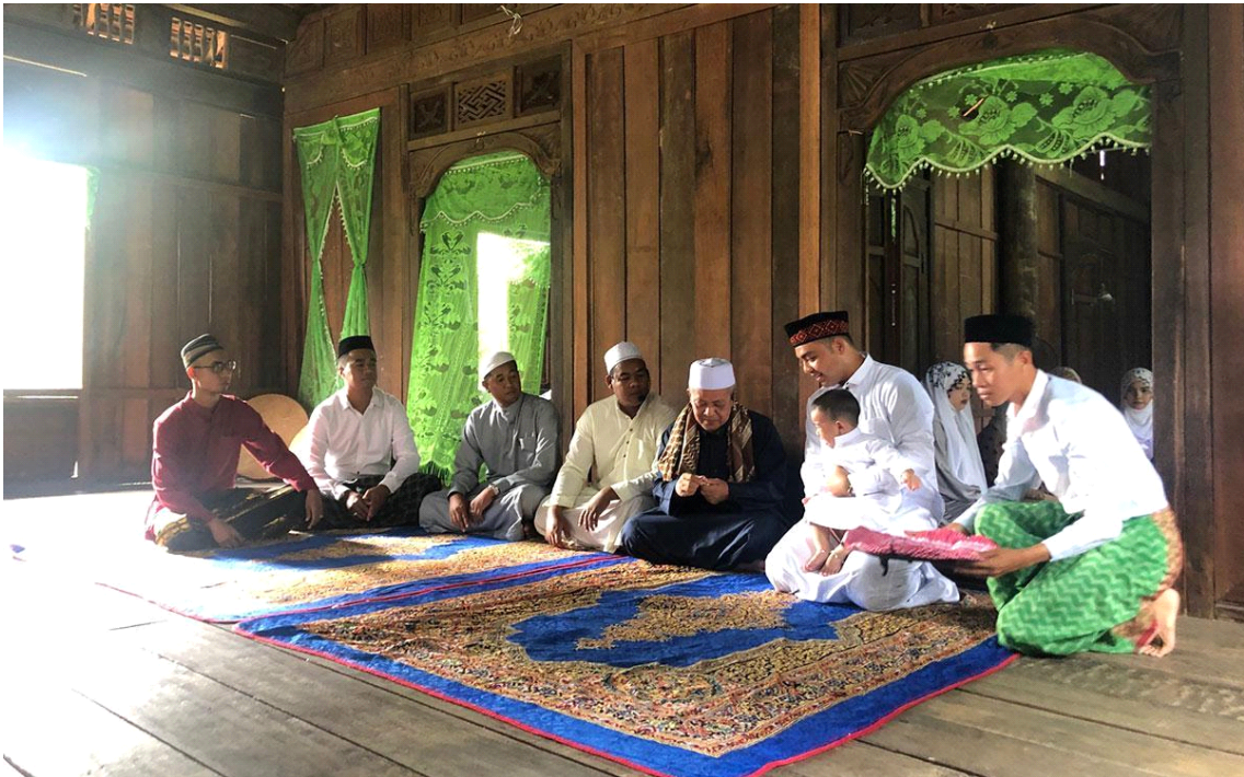
찰(Chăm) 무슬림을 위한 아기의 머리 자르기 및 명명식(命名式)

이 지역의 대부분의 사람들과는 달리 캄보디아 국경에 있는 찰(Chăm)족은 무슬림이다. 이슬람이 도입된 날짜는 확실하지 않지만 말레이(Malay)족의 영향력은 찰(Chăm)족의 무슬림 관습을 복원하고 강화하였다. 그럼에도 불구하고 찰(Chăm)족 사이에서는 돼지고기를 먹고 술을 마시는 것을 금지하는 등 이슬람 율법의 제한이 완화되었다. 각 마을에는 아이들이 코란(قرآن, Qur'an) 7) 을 교육받는 모스크(مسجد, mosque) 8) 가 있다.