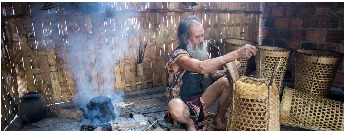
대나무공예품을 만드는 자라이(Gia Rai)족, 사진: 탄닷(Thành Đạt)