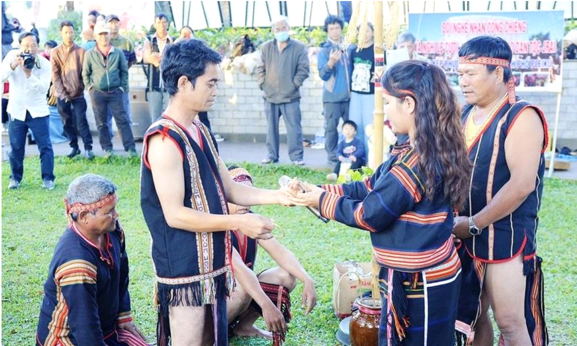
자라이(Gia Rai)족의 결혼반지 교환 의식

자라이(Gia Rai)족은 애니미즘 4) 을 신봉하는 이들로써, 영적 세계의 존재와 '양(yang:신)' 및 자연과 사회를 지배하는 초자연적인 힘을 믿는다. 이들이 믿는 신으로는 산의 신(yang chu), 물의 신(yang pen ia), 조상의 신(yang pen tha), 족장의 신(yang ptao), 전쟁의 신(yang bla) 등이 있다.