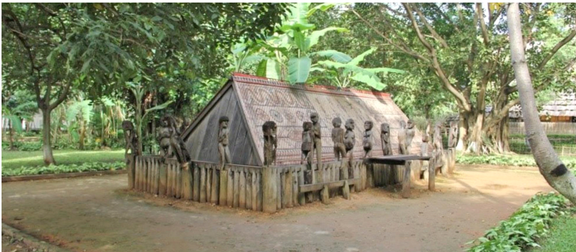
자라이(Gia Rai)족 무덤

위의 내용은 미전도종족선교연대(UPMA)에서 정리작성한 내용이므로, 무단으로 복제하여 상업적인 용도로 사용하지 마시고, 인용하여 사용하실 경우에는 출처를 반드시 남겨주시시오.