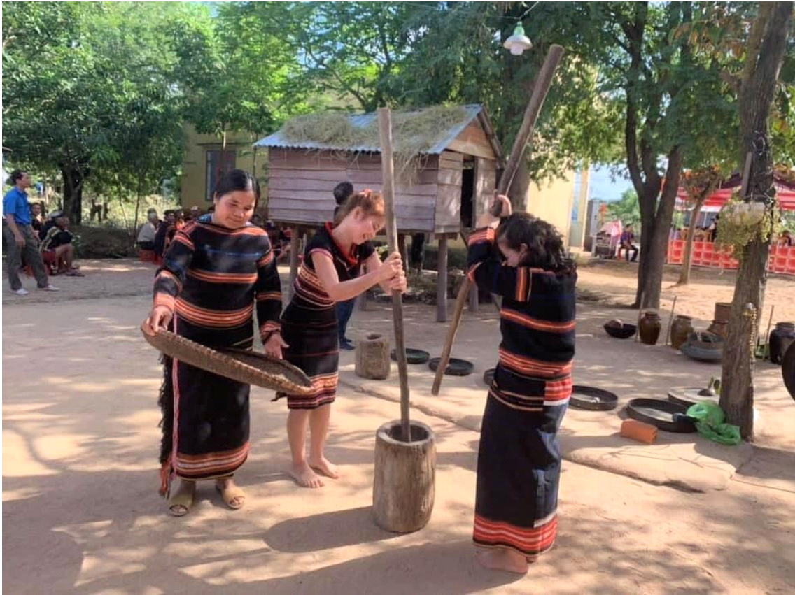
절구로 떡을 치고 있는 모습, 사진출처: baodantoc.vn