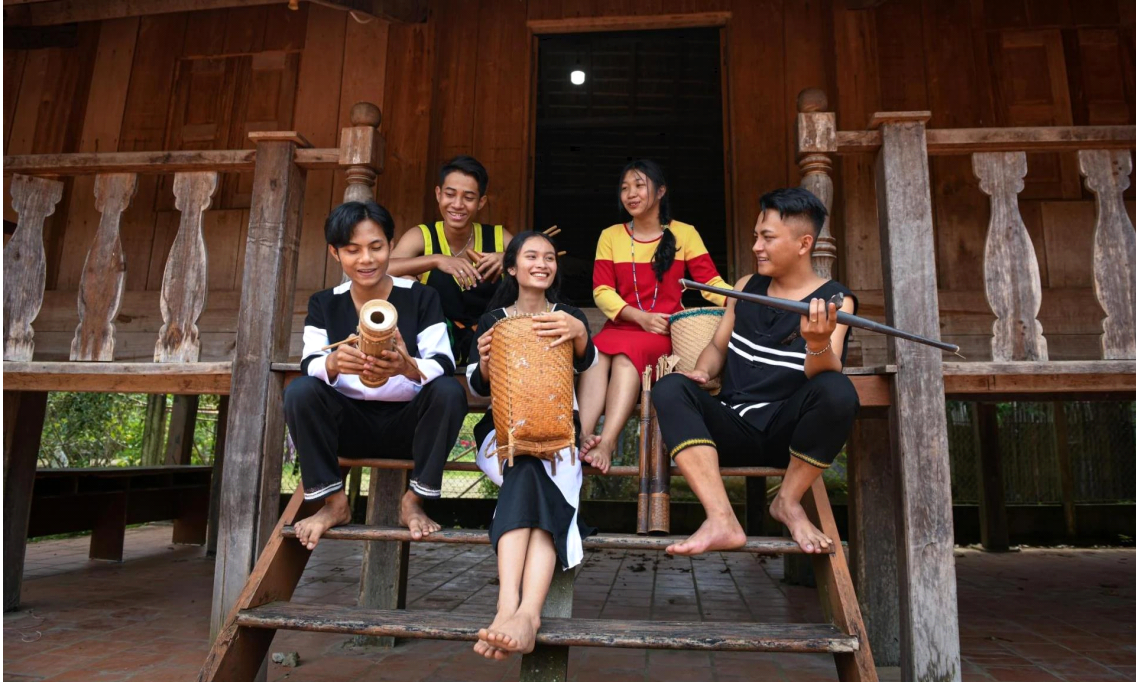
전통의상을 입은 라글라이(Ra Glai)족

(Loincloth) 4) 를 입었다. 전통적인 축제일에는 여성들이 아오자이를 입는데, 그 위에 빨간색과 하얀색 사각형이 번갈아 겹쳐져 있다.