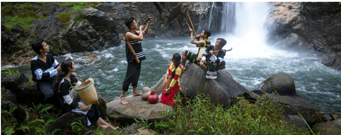
라글라이(Ra Glai)족

라글라이(Ra Glai)족은 모계 사회이며, 모계 씨족 외 결혼제도와 막내 딸 상속 등의 규칙이 있다. 일단 라글라이(Ra Glai)족의 아들은 아버지의 이름에, 딸은 어머니의 이름에 가까운 발음의 이름을 붙이는 관행을 가지고 있었지만, 반프랑스 전쟁부터 낀(khin)족과의 협력 관계를 통해 군사상의 필요에 따라 모계 씨족의 성에 낀(khin)족 풍의 이름을 채택하게 되었다. 또한 이전에는 금지된 다른 종족과 결혼하는 사람도 늘고 있다.