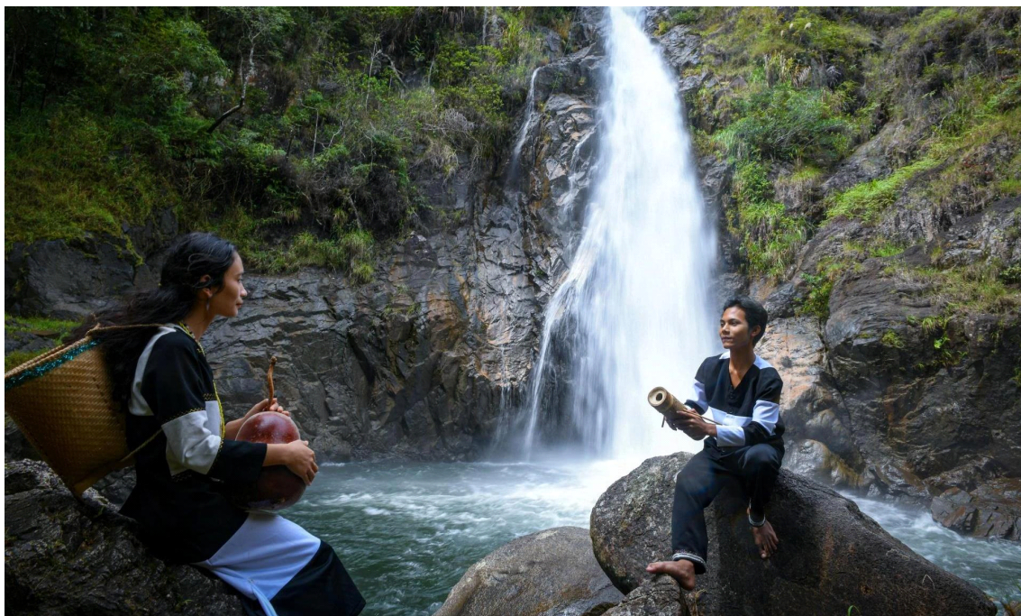
라글라이(Ra Glai)족

결혼은 여러 단계와 복잡한 절차를 거쳐야 한다. 결혼식은 양가가 함께 거행하며, 신부 측이 먼저, 신랑 측이 두 번째로 치른다. 결혼식에서 가장 중요한 것은 신랑신부가 돛자리를 펴는 예식이다. 이 돛자리 위에 신랑과 신부가 앉아 양가의 두 삼촌이 결혼에 대해 조상들과 신들에게 제사를 지낸다. 두 가족이 지켜보는 가운데 첫 식사를 함께한 곳도 바로 이 돛자리 위에서도이다.